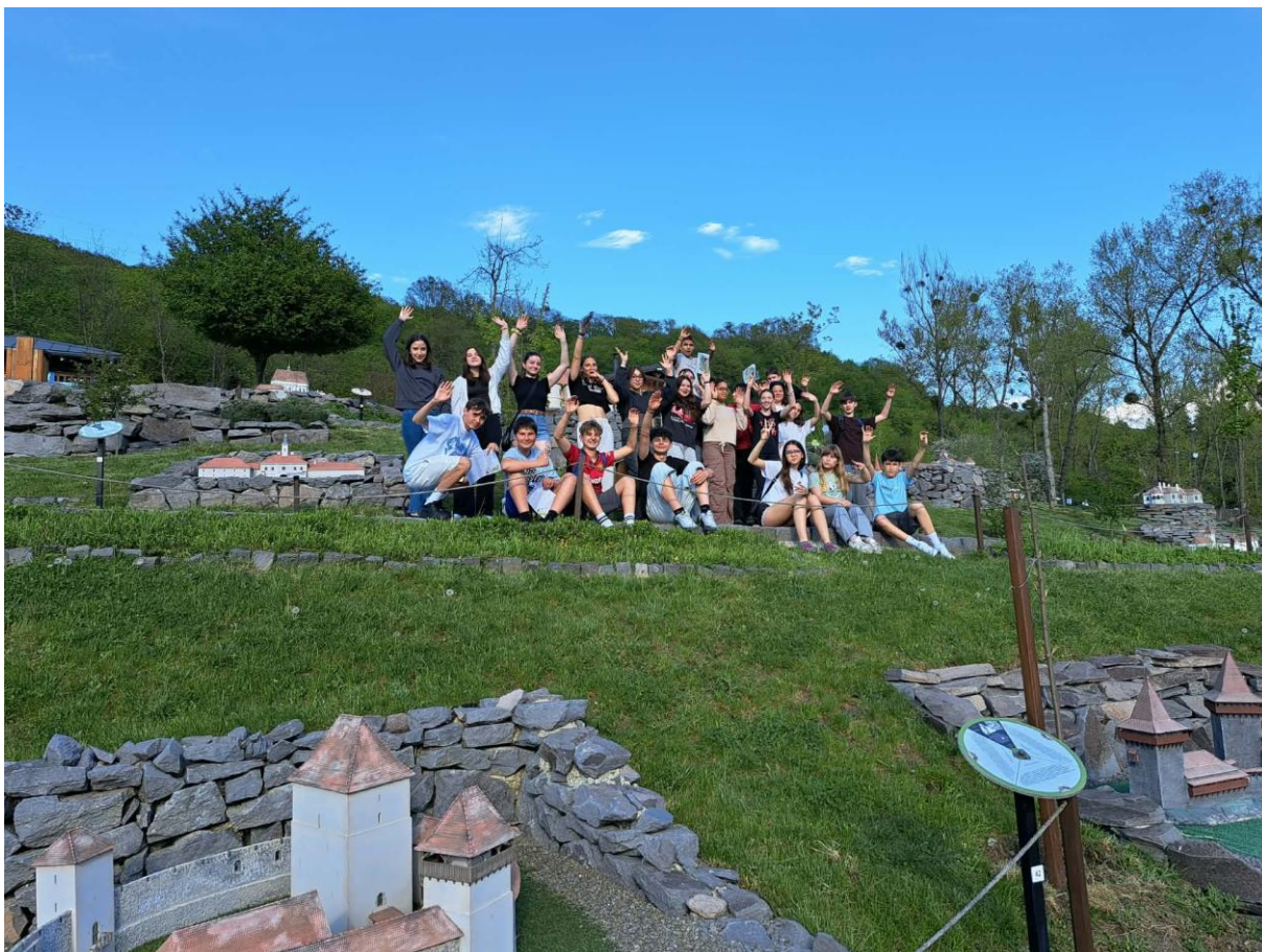
Szejkefürdő, Mini Erdély