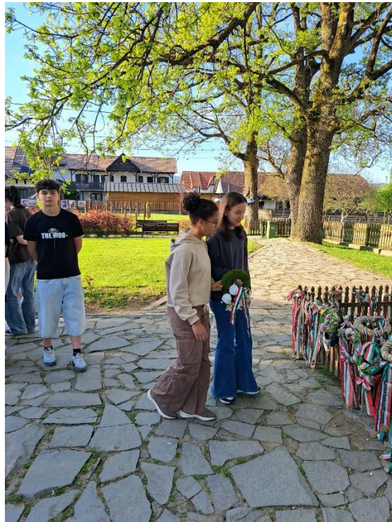
Farkaslaka, Tamási Áron sírja