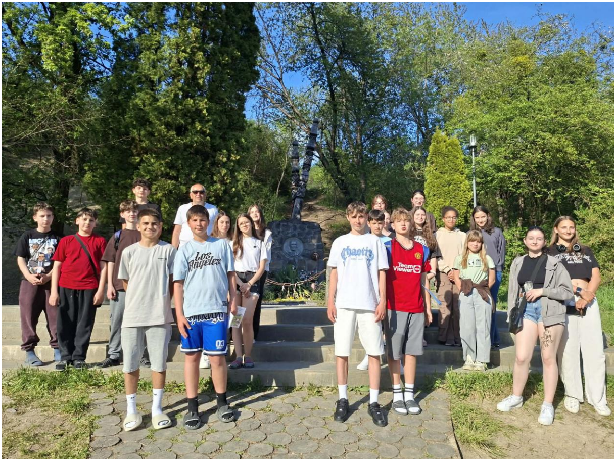
Orbán Balázs sírja