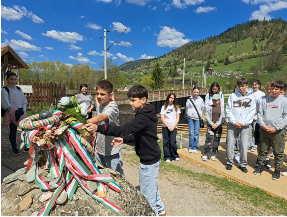
Gyimesbükk - Ezer éves határ