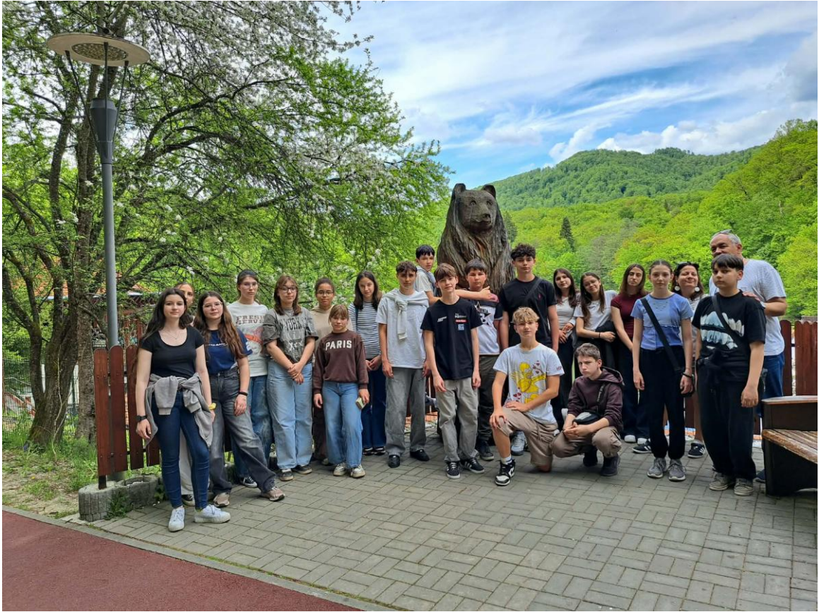
Szováta - Medve tó