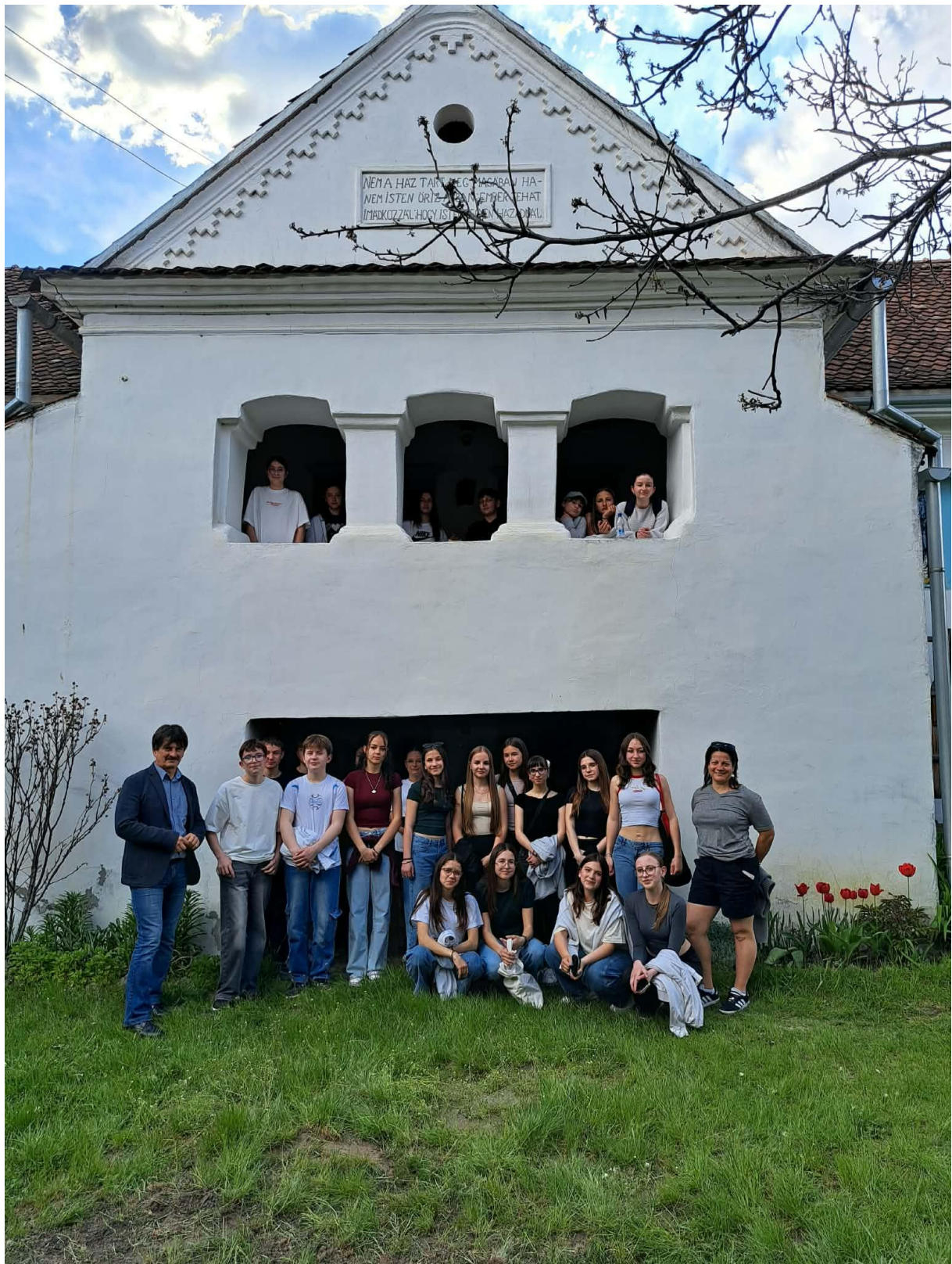
Lövétei Általános Iskola és tájház